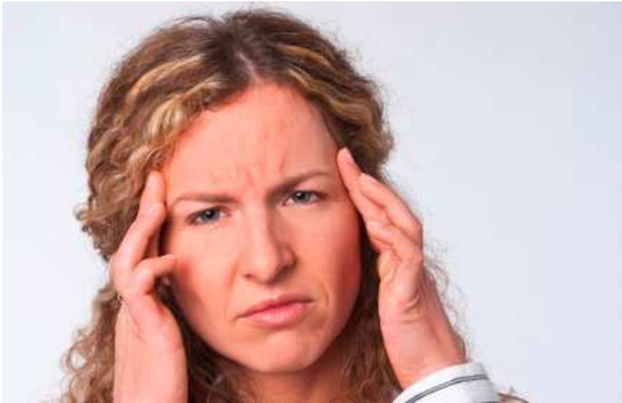
Traditionelle Chinesische Medizin hilft bei Kopfschmerzen.